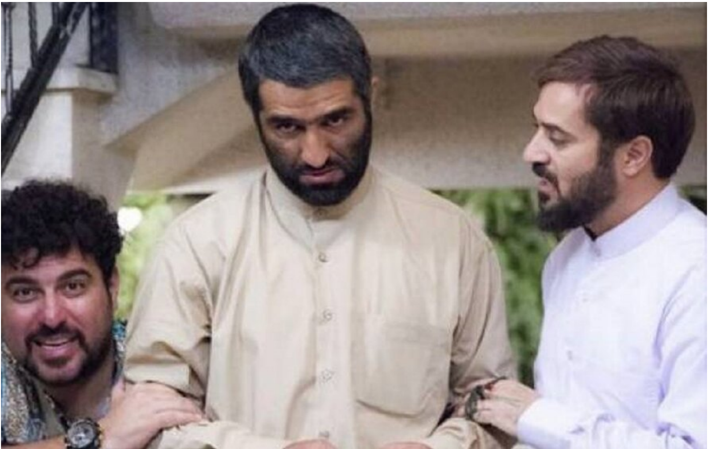
دانلود فیلم دینامیت با لینک مستقیم